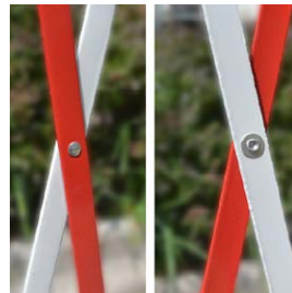
RIVETS ACIER RENFORCÉS