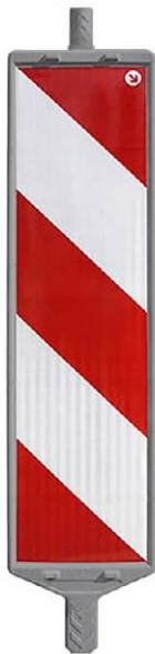
VERSION STANDARD POLYÉTHYLÈNE HAUTE DENSITÉ (PEHD) RECYCLÉ