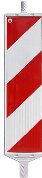
VERSION RENFORCÉE POLYÉTHYLÈNE HAUTE DENSITÉ (PEHD) VIERGE