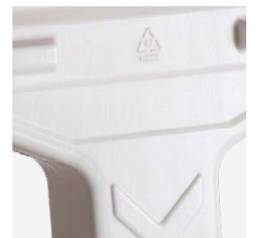
NOM DE L'ENTREPRISE OU LOGO