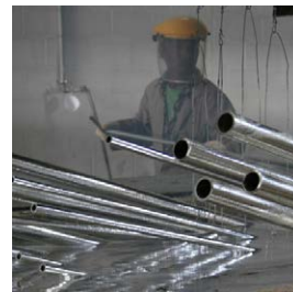
GALVANISATION À CHAUD